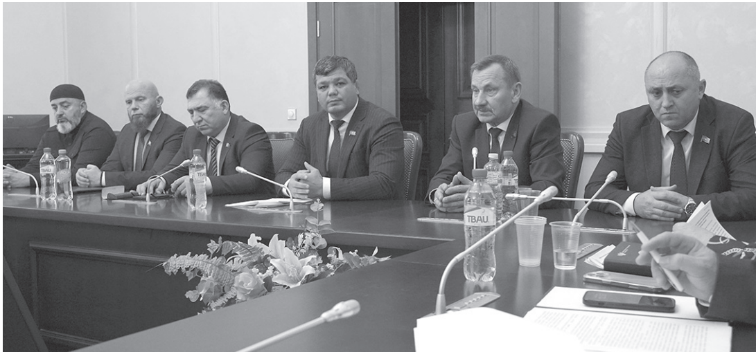
На расширенном заседании в Парламенте КЧР

18 декабря в Черкесске, в Большом зале Дома Правительства, состоится очередное, семнадцатое, пленарное заседание (сессия) Народного Собрания КЧР седьмого созыва (начало в 11 часов), на котором будут рассмотрены: — проект закона Карачаево-Черкесской Республики № 137-VII «О республиканском бюджете КЧР на 2026 год и на плановый период 2027 и 2028 годов» (второе чтение); — проект закона Карачаево-Черкесской Республики № 138-VII «О бюджете Территориального фонда обязательного медицинского страхования КЧР на 2026 год и на плановый период 2027 и 2028 годов» (второе чтение) и другие вопросы.