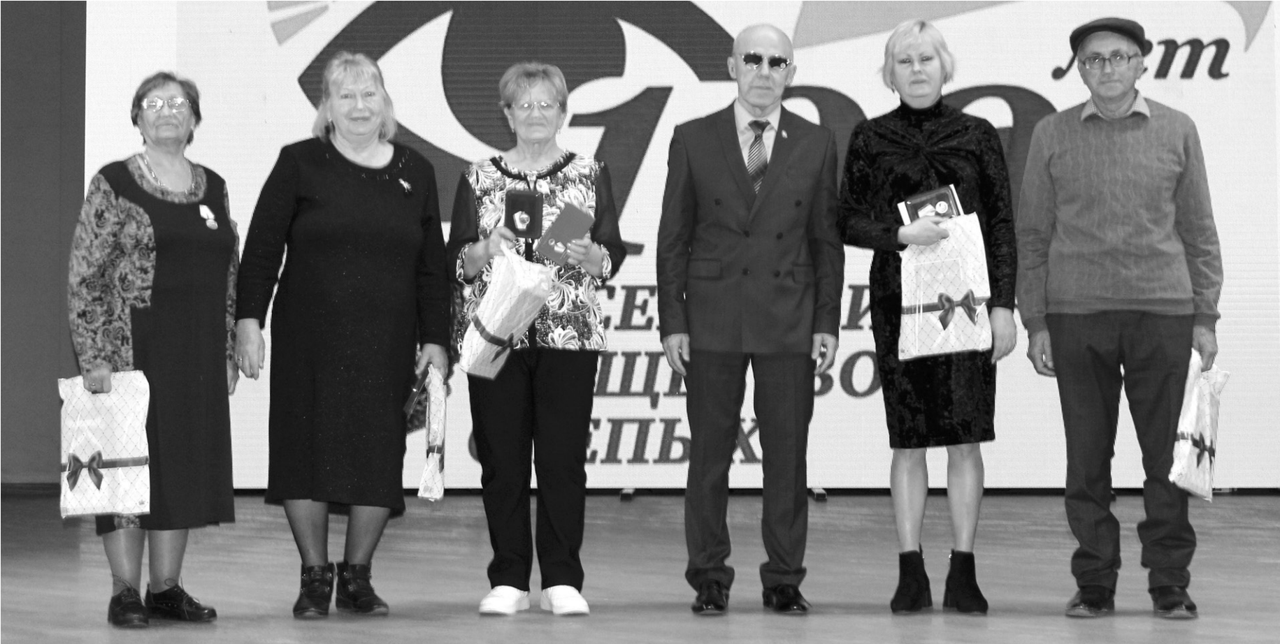
Момент церемонии награждения членов ВОС

— Когда я впервые пришла в ВОС, это был очень непростой период моей жизни. После серьезной травмы глаза я столкнулась с угрозой полной потери зрения. Благодаря операции по пересадке роговицы и поддержке специалистов мой глаз удалось спасти. А здесь, в Обществе слепых, меня приняли так, будто я