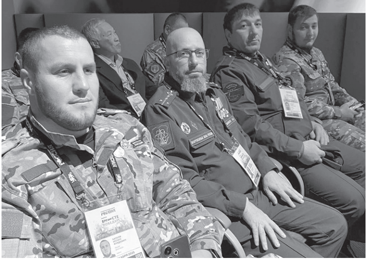
Делегация КЧР на форуме «Вместе победим»