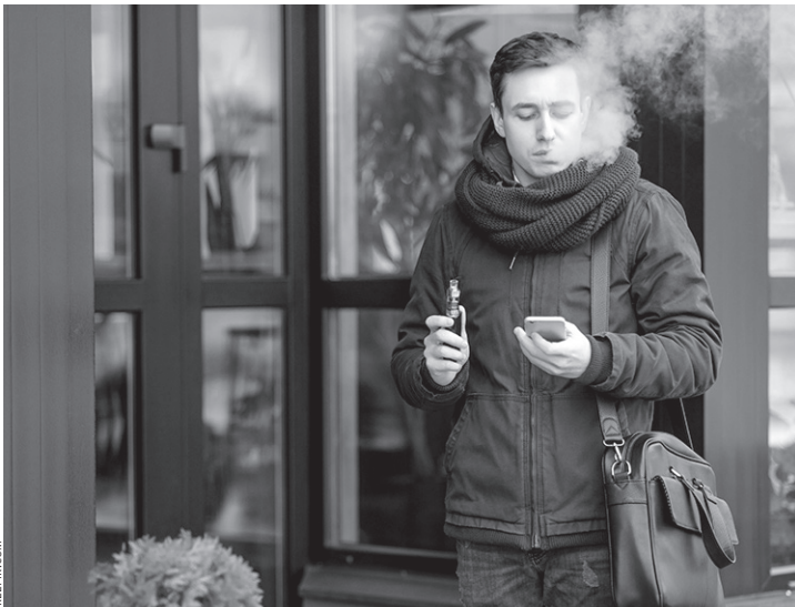
Курение вейпа не менее вредно, чем курение обычных сигарет

— Вейп, кальян, электронная сигарета, системы нагревания табака — все это содержит никотин, а значит, все они вредны для здоровья. На данный момент производители вейпов уже