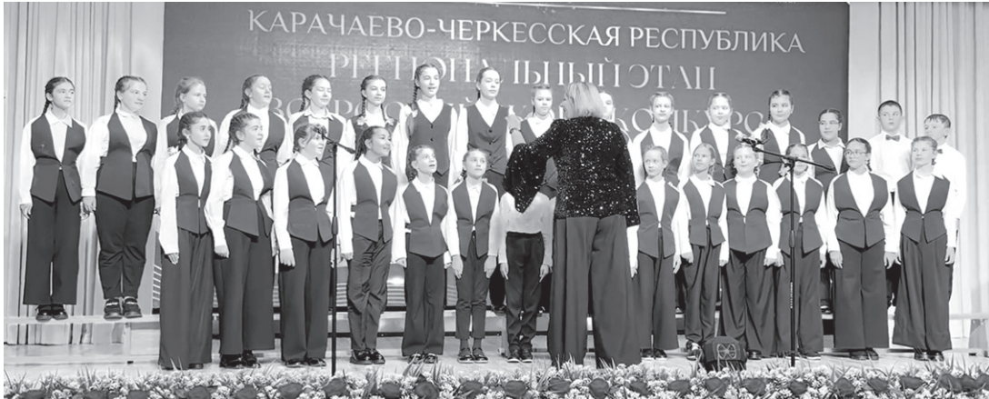
Выступает хор «Созвездие» СОШ имени Д. А. Старикова п. Кавказского