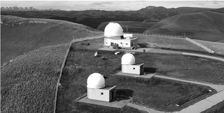
Кавказская горная обсерватория МГУ

Председатель Правительства России Михаил Мишустин вручил ректору Московского государственного университета им. М. В. Ломоносова Виктору Садовничему премию Правительства России в области науки и техники за создание, развитие и выдающиеся научные достижения астрономического учебно-научного комплекса «Кавказская горная обсерватория МГУ», которая расположена в горах КЧР.